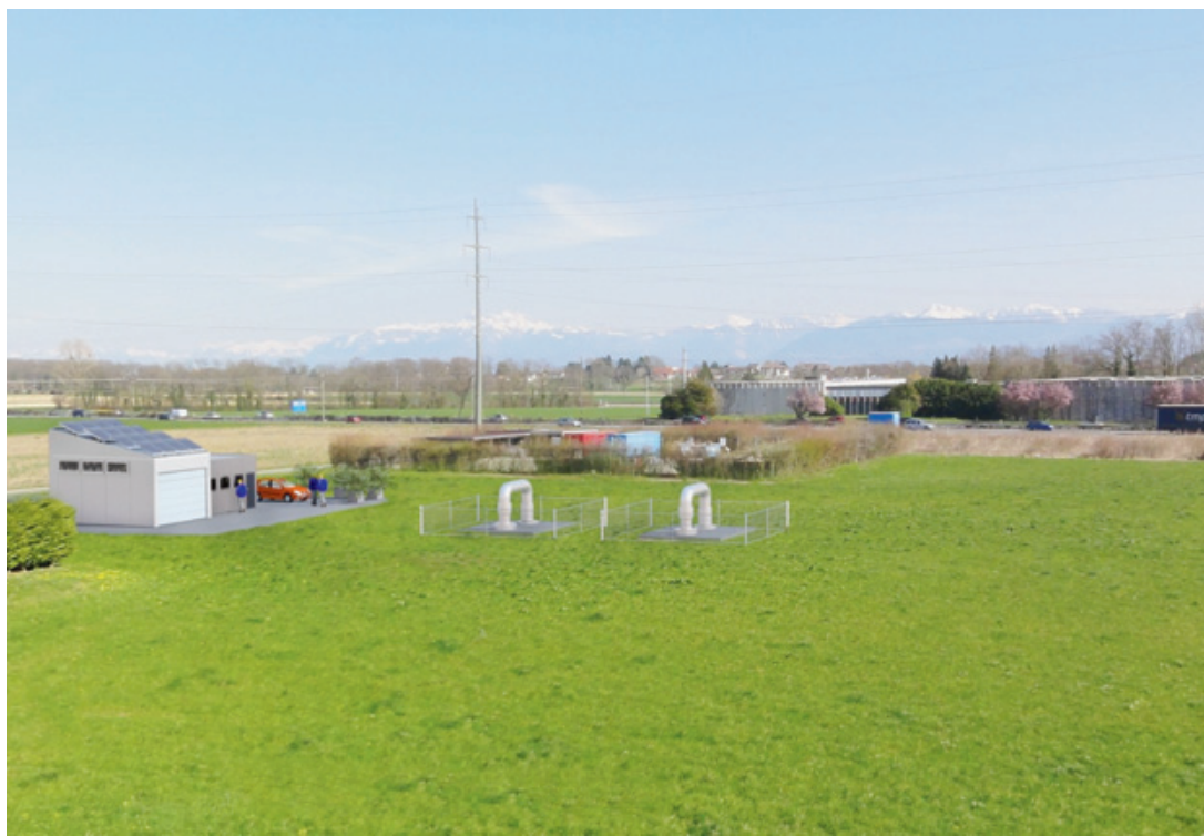
Cette image de synthèse montre que l'installation de géothermie sera assez discrète.

VINZEL Quatre partenaires régionaux se sont unis pour mener à bien l'installation d'une plateforme de forage pour la géothermie.